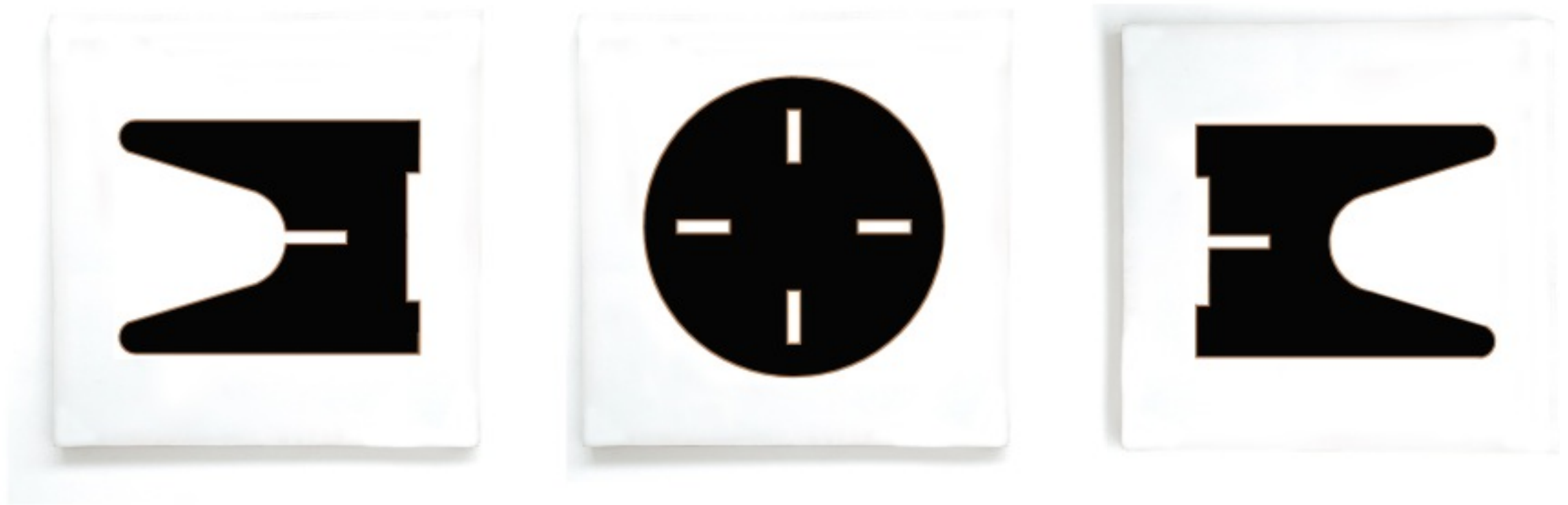
Chair 4 Relieve en madera, pintado