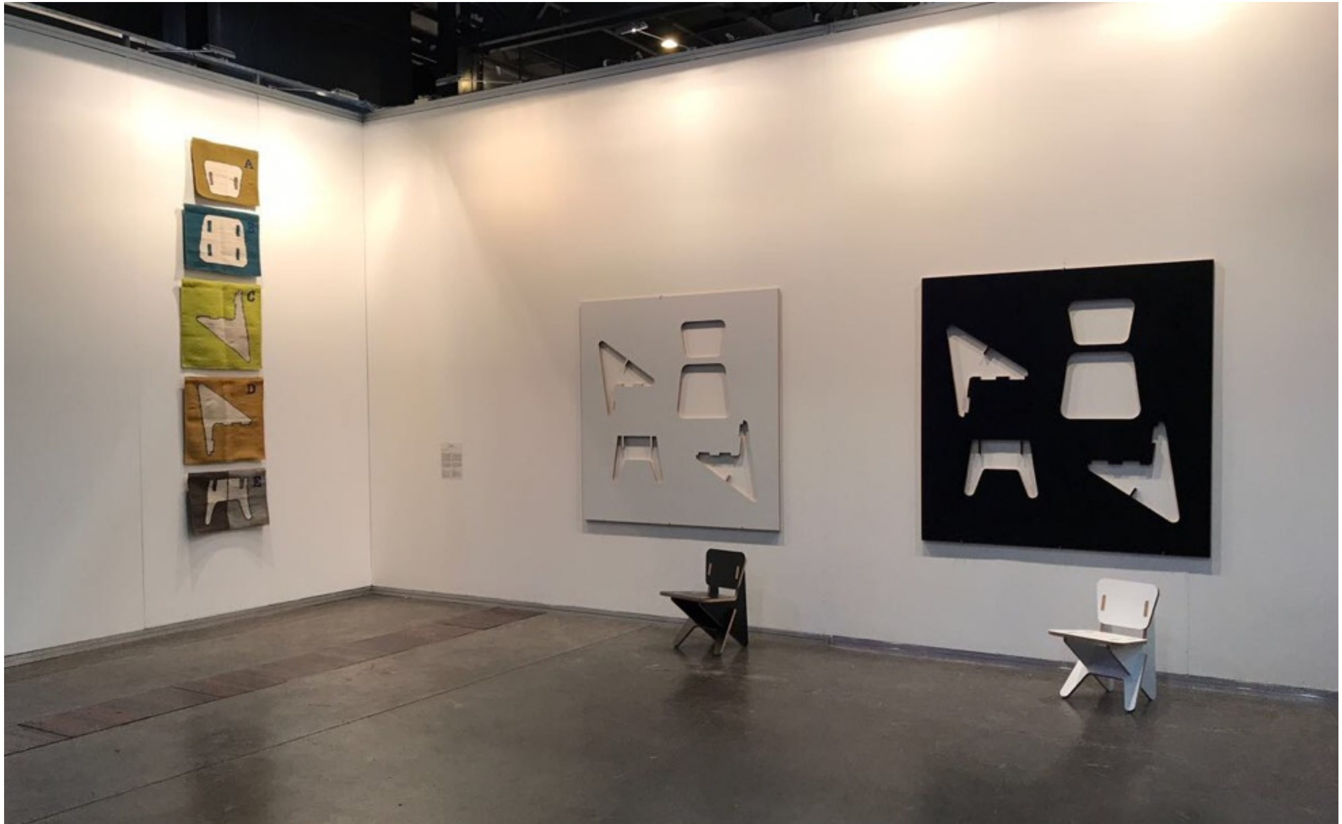
Chair 4 Instalación 2017