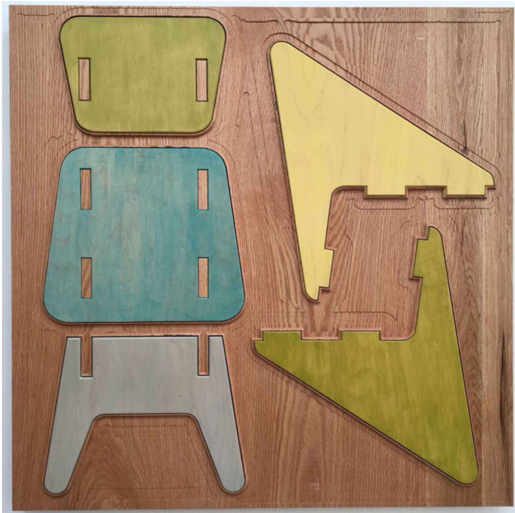
Chair 4 Relieve en madera, policromado