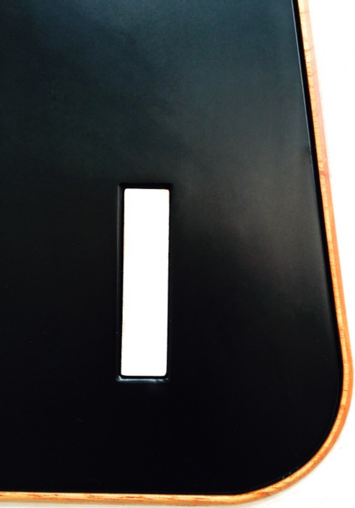
Chair 4 Relieve en madera, pintado Detalle