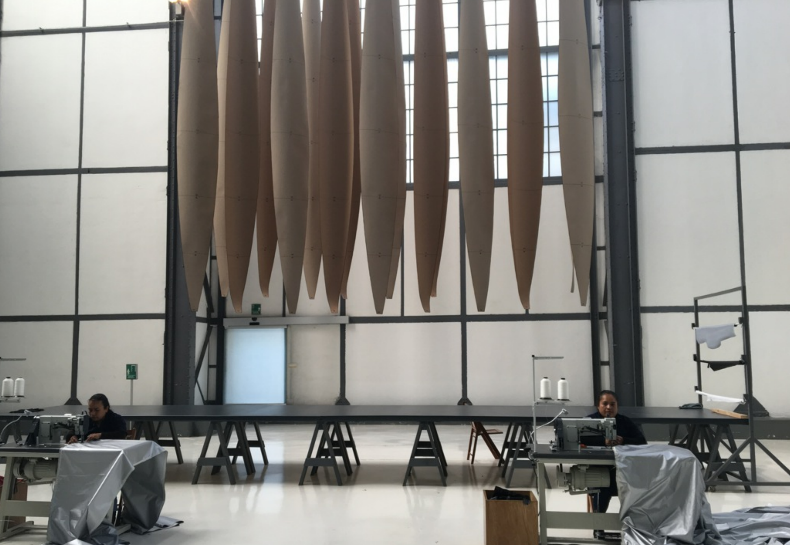
Taller de Confección. Museo Universitario del Chopo